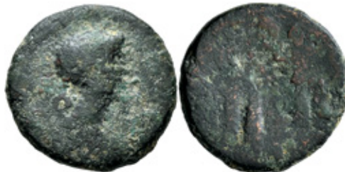
R. Arakelian collection, 11,23 g, 24 mm, 12 h.