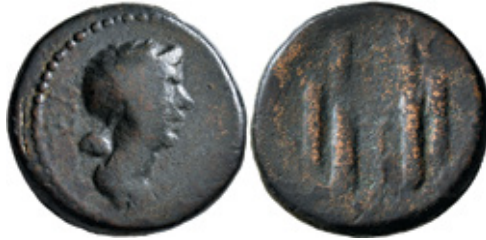
Other documented copies:

Reference copy: Vahé Gabrache collection.