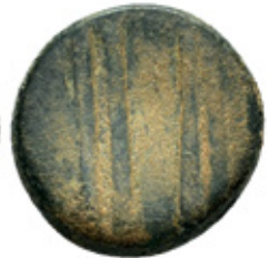
Biga Numismatics, Online Auction 22, 2 September 2023, 13,08g, 24 mm, 12h