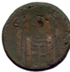
History Museum of Armenia, n. Inv. 19992-75, 12.36 gr, 23,5mm, 1 h.