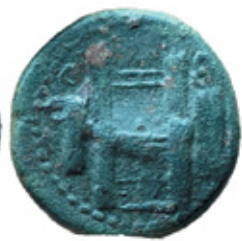
Private collection, Yerevan, 11,43g, 22,3mm, 12 h.