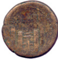
History Museum of Armenia, n. Inv. 20093-4, 14.49 g, 25.3 mm, 12 h.